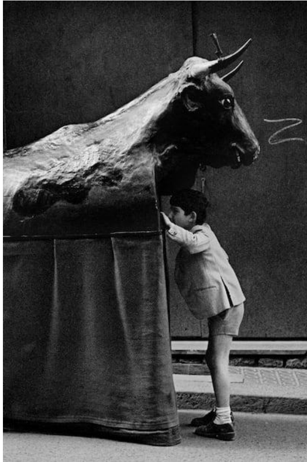
Cristina García Rodero

El Toro. Solsona. Serie España Oculta, 1977 Gelatina de plata con tratamiento de archivo al selenio 53 x 80 cm